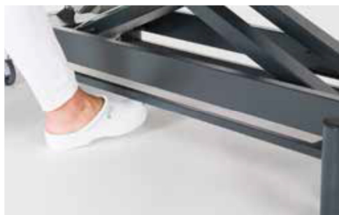
Giove 4 con pedaliera circolare