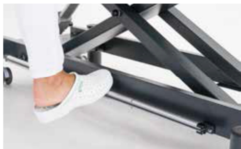
Giove 4 con pedaliera circolare in alluminio