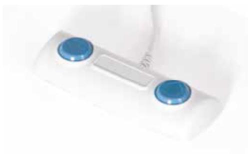
Giove 4 con comando a pedale 24 V