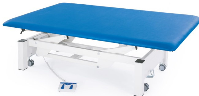
Table TITAN à un plan réglable électriquement en hauteur. Table professionnelle de grande taille utilisée pour le traitement avec la méthode thérapeutique Bobath.