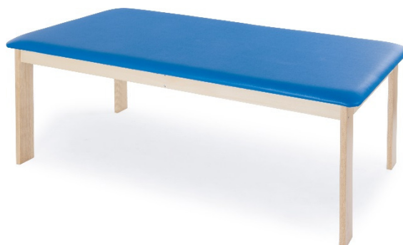
Table PROTEO à un plan en bois et à hauteur fixe. Table professionnelle utilisée par professionnels du secteur de la rééducation et du massage.