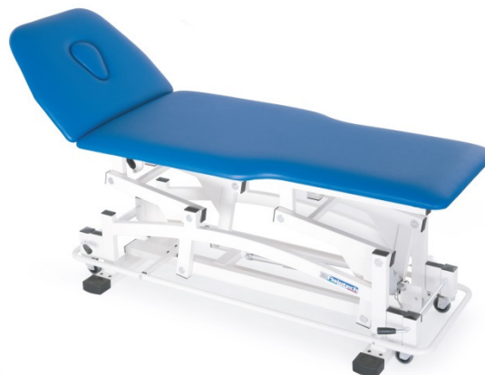
Table MONTELEONE à deux plans réglable en hauteur électriquement ou hydrauliquement pour kinésithérapie, massage et examen.