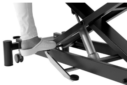
Giove 2 hydraulique