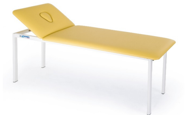
Table GEA à deux plans en métal et à hauteur fixe. Table professionnelle utilisée par professionnels du secteur de la rééducation et du massage.