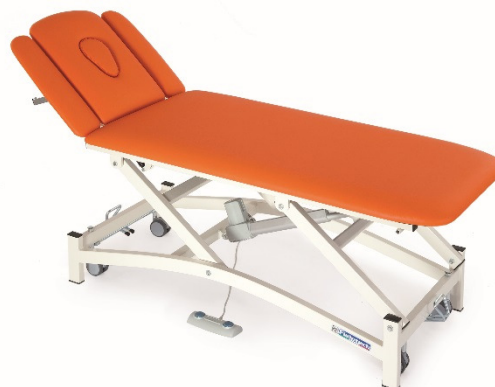
Table ERMES / ERMES LARGE à quatre plans réglable en hauteur électriquement ou pour kinésithérapie, massage et examen.