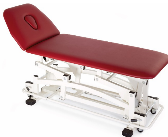
Table EDO à deux plans réglable en hauteur électriquement ou hydrauliquement pour kinésithérapie, massage et examen.