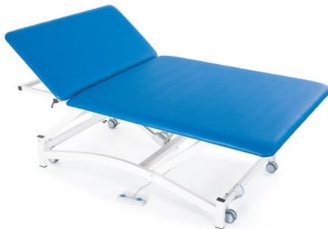
Table BOBATH 2 à deux plans réglable électriquement en hauteur. Table professionnelle de grande taille utilisée pour le traitement avec la méthode thérapeutique Bobath.