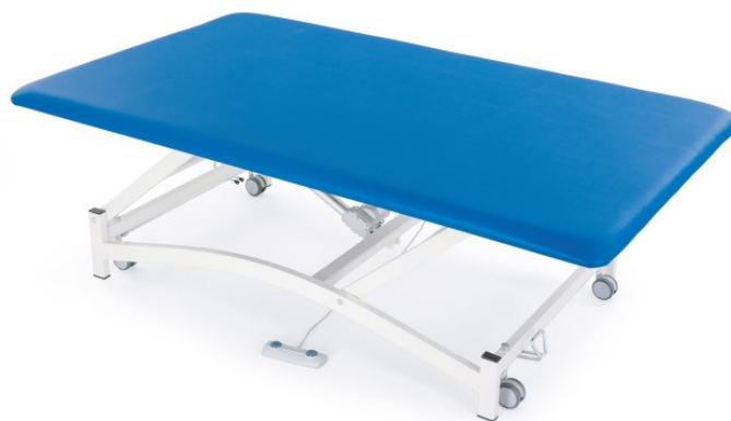
Table BOBATH XS à un plan réglable électriquement en hauteur. Table professionnelle de grande taille utilisée pour le traitement avec la méthode thérapeutique Bobath.