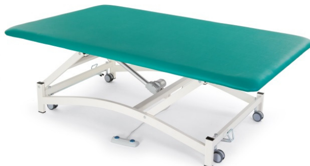
Table BOBATH S à un plan réglable électriquement en hauteur. Table professionnelle de grande taille utilisée pour le traitement avec la méthode thérapeutique Bobath.