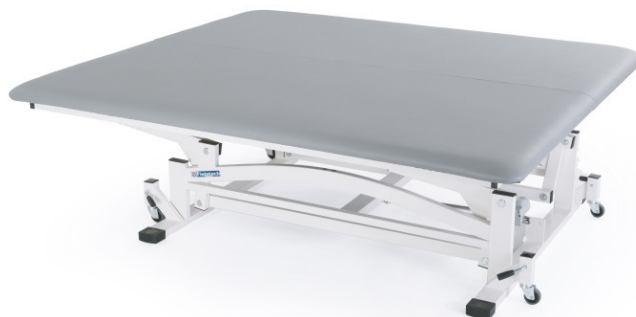
Table BOBATH L à un plan réglable électriquement en hauteur. Table professionnelle de grande taille utilisée pour le traitement avec la méthode thérapeutique Bobath.