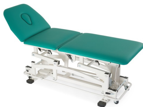
Table ATENA à trois plans réglable en hauteur électriquement ou hydrauliquement pour kinésithérapie, massage et examen.