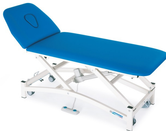
Table ARIOSTO / ARIOSTO LARGE à deux plans réglable en hauteur électriquement ou pour kinésithérapie, massage et examen.