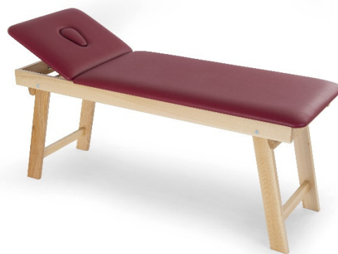
Table ARES à deux plans en bois et à hauteur fixe. Table professionnelle utilisée par professionnels du secteur de la rééducation et du massage.