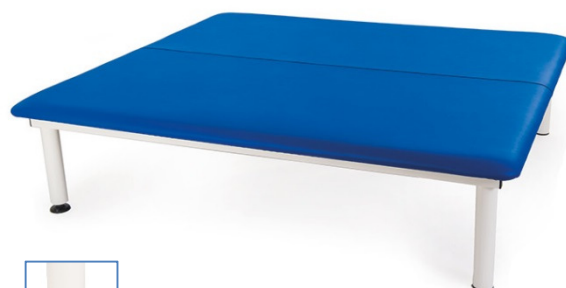
Table ADE.180 à un plan et hauteur fixe. Table professionnelle de grande taille utilisée pour le traitement avec la méthode thérapeutique Bobath.